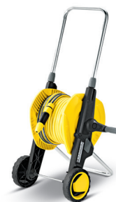
Schlauchwagen HT 3.420 Kit 1/2"