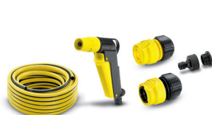
Schlauchset, 20 m