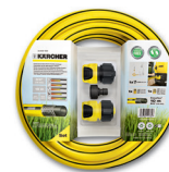
Schlauchanschluss-Set für Hochdruckreiniger