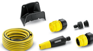
Schlauchset mit Schlauchhalterung, 15 m