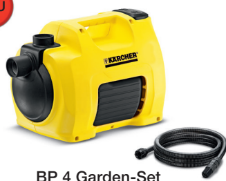
BP 4 Garden-Set