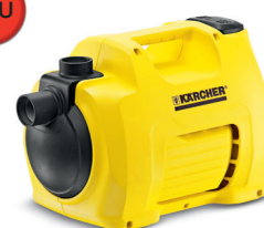
BP 2 Garden