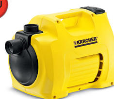
BP 3 Garden