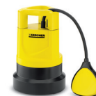
SCP 7000 | 6000