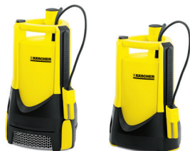
SCP 16000 IQ Level Sensor | SCP 12000 IQ Level Sensor