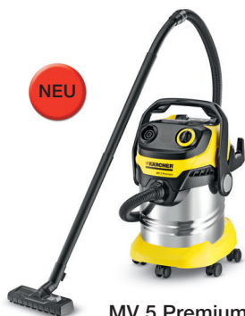
MV 5 Premium