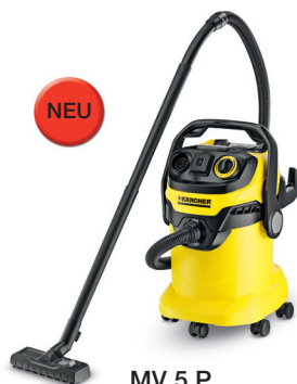
MV 5 P

Egal ob Flüssigkeiten oder trockener Schmutz – die Kärcher Nass-/Trockensauger sorgen für kompromisslose Sauberkeit.