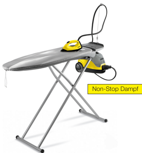
SI 2.600 CB

Im Lieferumfang des Dampfreinigers ist umfangreiches Zubehör enthalten. Für noch mehr Anwendungsmöglichkeiten.