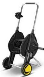
Schlauchwagen HT 4.500

Beim Transport oder bei der Lagerung kann der Schlauch am Gerät sicher fixiert werden.