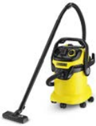
WD 5 P

Volle Saugleistung binnen Sekunden: Dank integrierter Filterreinigung befördern starke Impuls-Luftströme Schmutz auf Knopfdruck in den Behälter.